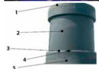
1. Capac, 2. Prolungire H 600 mm, 3. Piesa fixare, 4. Garnitura, 5. Rezervor